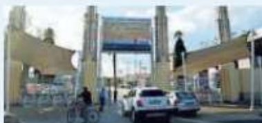
▲ La sede La Fiera del Levante

C'è tempo fino al 1° ottobre per candidarsi partecipare a Design To Business, iniziativa dedicata alla promozione delle eccellenze nel design e nella creatività, organizzata da Unioncamere Puglia, insieme alla Regione Puglia, e realizzata in collaborazione con Adi Puglia e Basilicata, Distretto Produttivo Puglia Creativa e con il patrocinio del Politecnico di Bari, nell'ambito della Fiera del